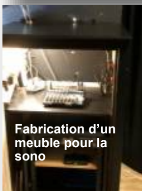
Fabrication d'un meuble pour la sono