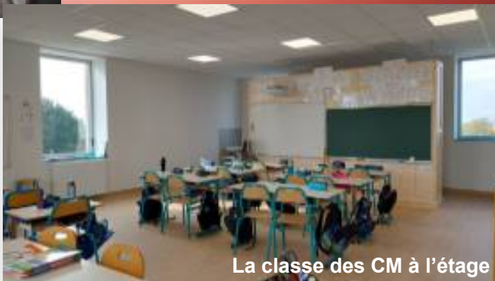
La classe des CM à l'étage