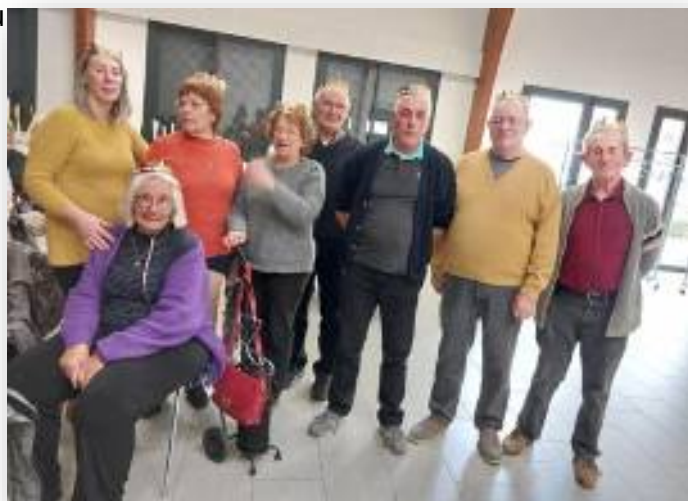
Ci-dessous la « galette des rois » avec les reines et les rois