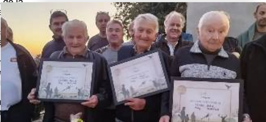
La remise des diplômes honorifiques à trois chasseurs