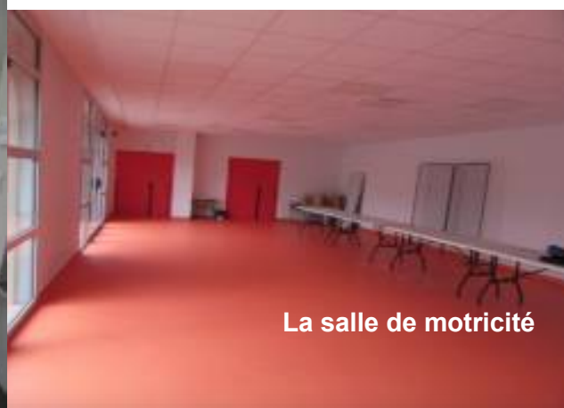
La salle de motricité