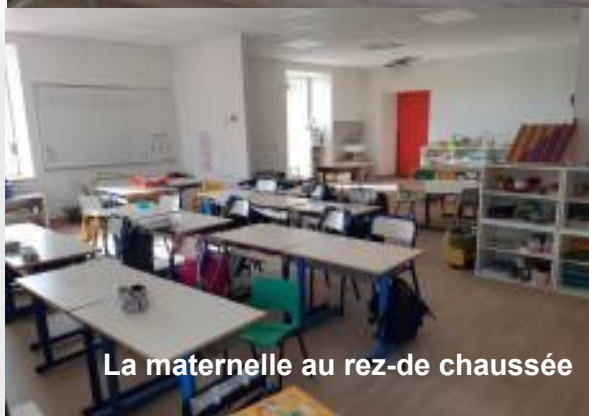
La maternelle au rez-de chaussée