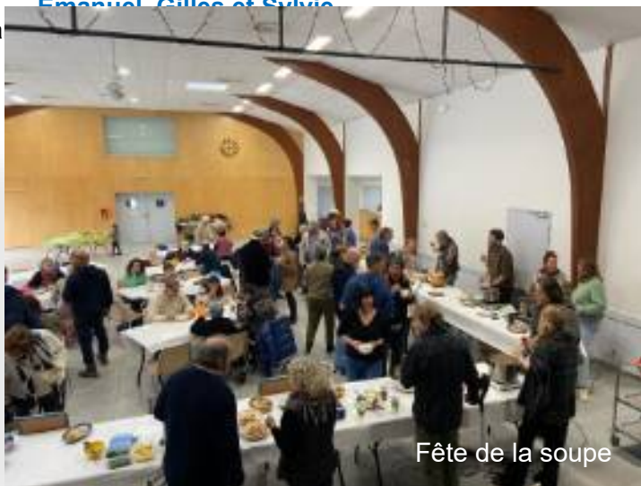
Fête de la soupe