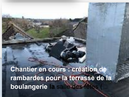
Chantier en cours : création de rambardes pour la terrasse de la boulangerie la salle des fêtes (