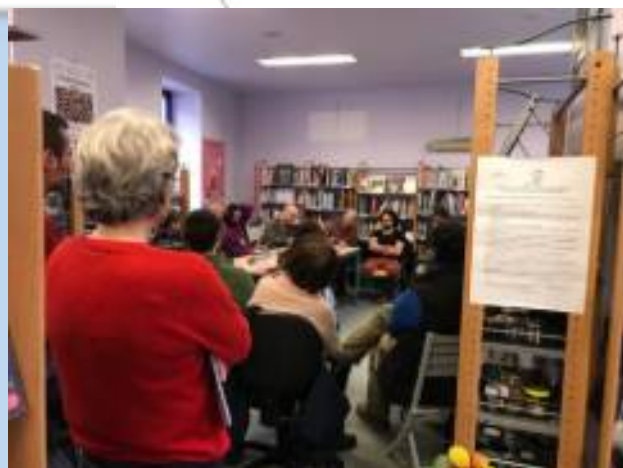
Table ronde des associations

Dans le cadre des rencontres populaires du Son O liort une table rondes des associations a été organisée le 22 février à la Médiathèque.