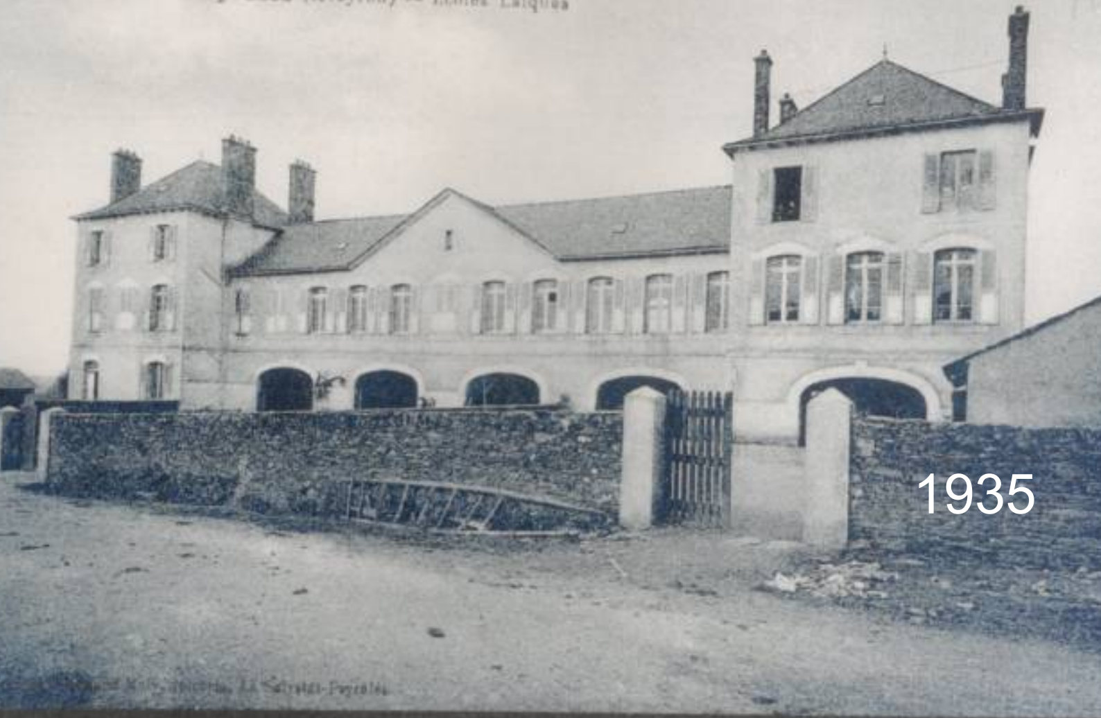
La Salvetat-Peyralès (Aveyron) -- Ecoles Laïques