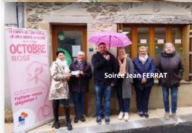
Soirée Jean FERRAT