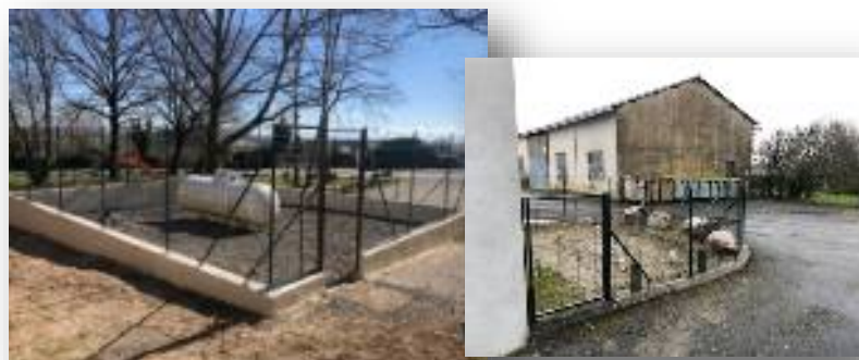
Sécurisation des cuves à gaz de la Boriette et de la salle des fêtes (réalisation des murs et clôtures).