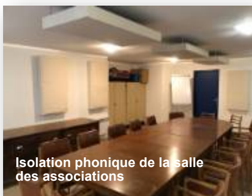
Isolation phonique de la salle des associations