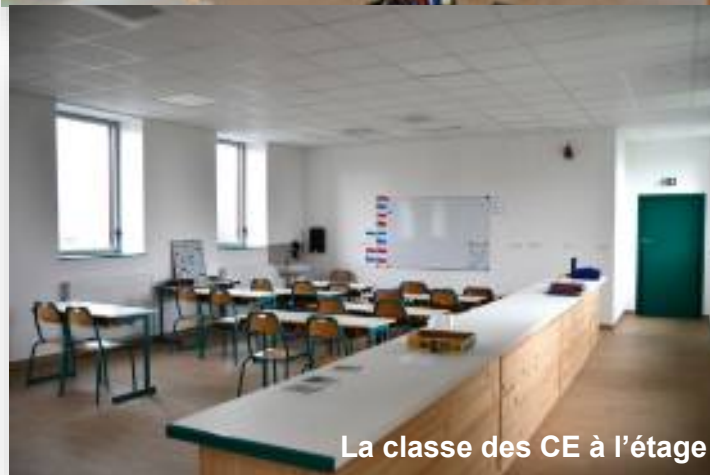
La classe des CE à l'étage

Ci-dessus les photos des classes et des nouveaux locaux.