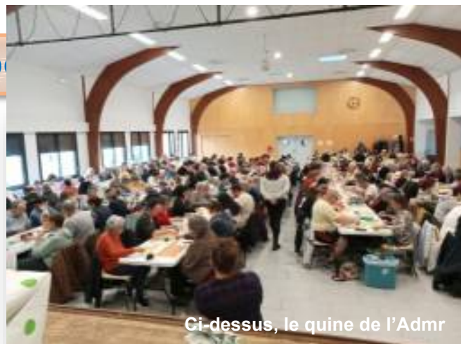
Ci-dessus, le quine de l'Admr

6 rue du Faubourg - Tél : 05 65 65 88 29