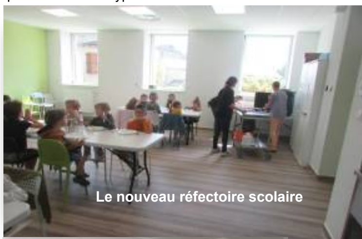
Le nouveau réfectoire scolaire

Ci-dessus: En remplacement de la chaudière fioul, il a été installé une chaudière utilisant des granulés de bois comme énergie. Pour le renouvellement d'air des centrales de traitement d'air double-flux pièce par pièce seront installées dans les salles de classe, cantine, motricité et multi-activité. La VMC des sanitaires et locaux à pollution sera de type basse consommation