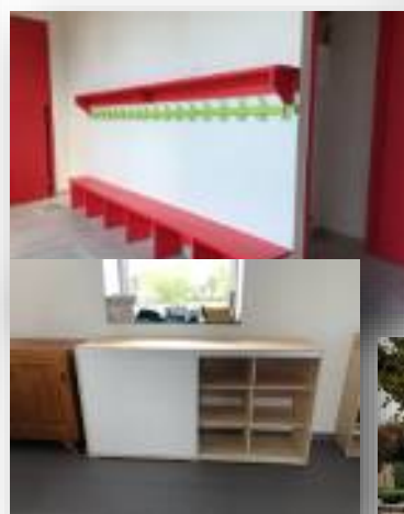
Ci-dessus : Création de meubles sur mesure pour les classes.