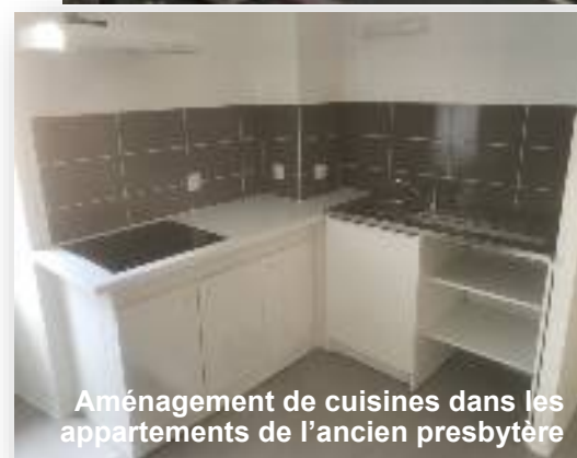
Aménagement de cuisines dans les appartements de l'ancien presbytère