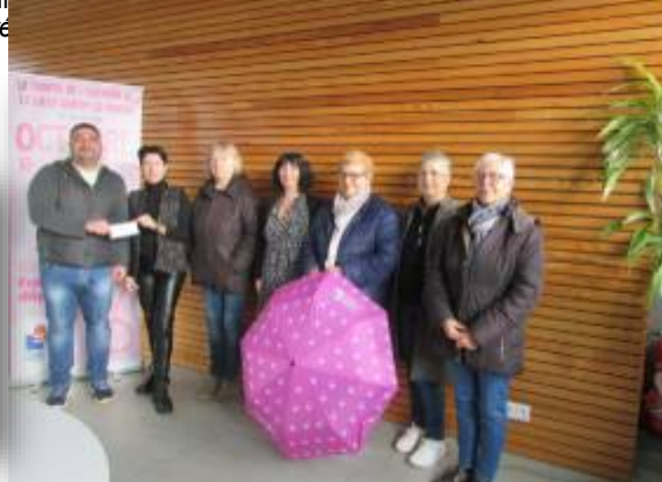
En haut à gauche la